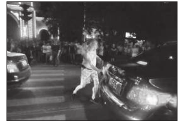
老人挥砖砸违章车

市民七： 有人说阎政新砸车是因为他想让我们知道“维护安全，人人有责”。可是维护安全也得以合法的方式来做啊。